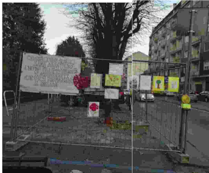
DISEGNI e scritte nei pressi del taglio tagliato