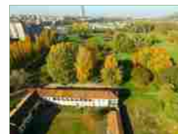
Veduta aerea su Cascina e Parco Le Vallere