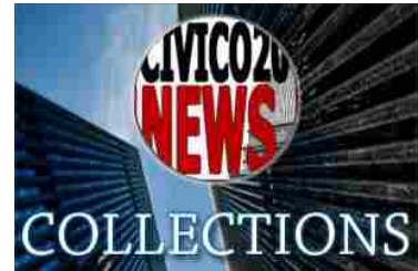
Le Collections di "Civico20". Articoli selezionati e raggruppati per autore ed argomento.