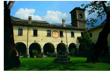
Città Metropolitana di Torino. L'abbazia di Novalesa (TO) riapre al pubblico la cappella di san Michele

Il workshop sarà suddiviso in due sessioni, una teorica e una pratica, in cui i professionisti potranno confrontarsi direttamente in prove dirette su sistemi e soluzioni tecnologiche. Il seminario riconoscerà crediti formativi per i professionisti e avrà una durata di sei ore.