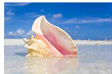
La conchiglia e il rumore del mare