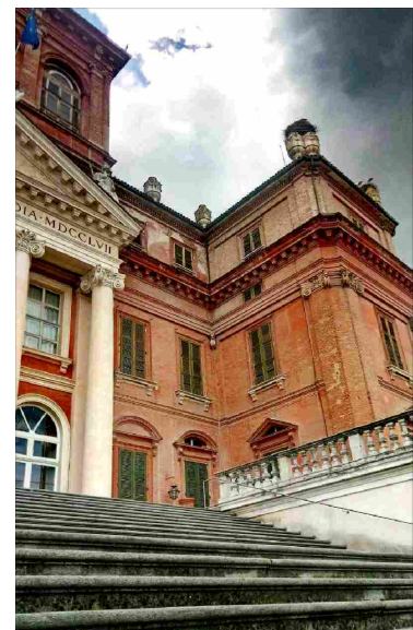
Saluzzo (CN) Le esperienze dei studenti del Liceo Bodoni