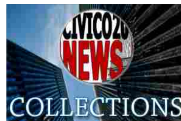
Le Collections di "Civico20". Articoli selezionati e raggruppati per autore ed argomento.