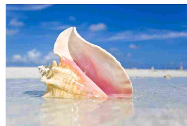
La conchiglia e il rumore del mare