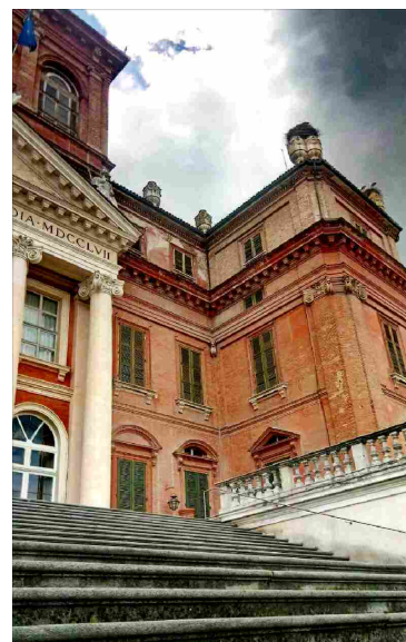
Saluzzo (CN) Le esperienze dei studenti del Liceo Bodoni