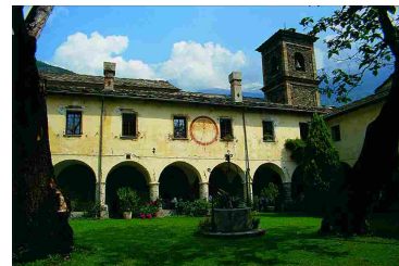
Città Metropolitana di Torino. L'abbazia di Novalesa (TO) riapre al pubblico la cappella di san Michele

Il workshop sarà suddiviso in due sessioni, una teorica e una pratica, in cui i professionisti potranno confrontarsi direttamente in prove dirette su sistemi e soluzioni tecnologiche. Il seminario riconoscerà crediti formativi per i professionisti e avrà una durata di sei ore.