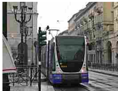
Questa sera sciopero dei mezzi pubblici: a rischio bus, tram, metropolitana e treni