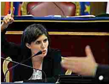
La sindaca porta i suoi assessori in ritiro, cala la fiducia e bisogna riprogrammare