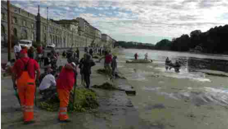
Lo sfalcio del Millefoglio eseguito lo scorso agosto dai volontari

LO SCORSO ANNO - Un anno fa, il problema del Myriophyllum aquaticum aveva caratterizzato l'estate torinese, portandosi dietro molte polemiche. La pianta era apparsa a fine luglio ed era rimasta nelle acque fino a ottobre inoltrato. Lo sfalcio dei volontari non aveva portato grandi risultati , anzi. Più volte i tavoli tecnici composti da Città di Torino, Città Metropolitana, Regione Piemonte, Arpa, Enea, Ipla e Università di Torino avevano provato a risolvere una questione «creata» dall'uomo. Sì, perché è molto probabile che la pianta tropicale sia arrivata nelle nostre acque per mano di un acquariofilo. 365 giorni dopo, il fiume Po è tornato verde: come verrà affrontato il problema quest'anno?