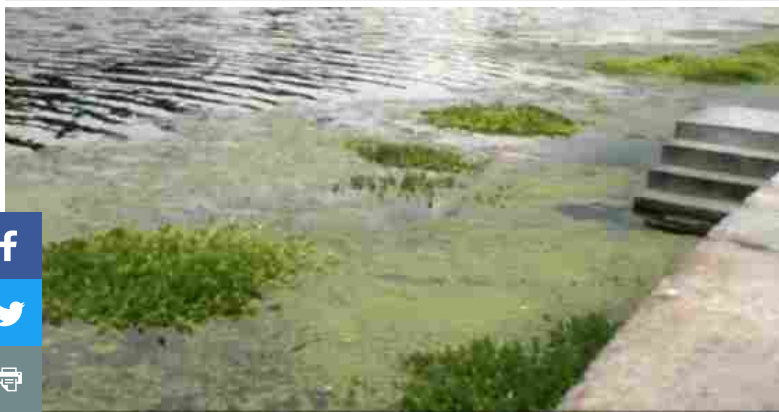
Millefoglio è tornato nelle acque del fiume Po

Consiglia Condividi 18 persone consigliano questo elemento. Iscriviti per vedere cosa consigliano i tuoi amici.