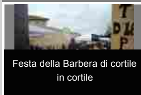
Festa della Barbera di cortile in cortile