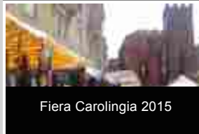
Fiera Carolingia 2015