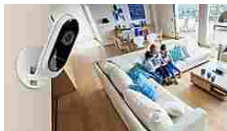
Verisure: l'allarme... Calcola il preventivo