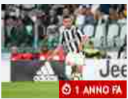
Juve Juve, ipoteca sullo Scudetto: Napoli battuto 2-1