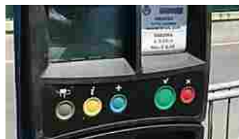
Rivoli, il pagamento della sosta ora si... La possibilità è già attiva dal 28 febbraio. Grazie al telefonino si paga soltanto per il tempo effettivo di parcheggio e si