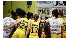
Coronavirus, la Lega... L'evento, che era in calendario nel prossimo weekend, posticipato al...