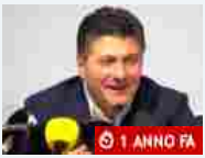
Toro Mazzarri non si fida: "Servirà il miglior Toro"