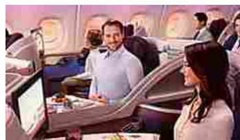
Da oggi si può volare nel massimo... Qatar Airways