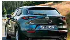
Mazda CX-30. Scopri... Mazda.it