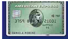
Richiedi Carta Verde... American Express