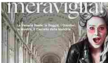
Domani riapre la Reggia di Venaria... Tra le novità, ingresso gratuito ai Giardini fino al 29 marzo e poi ogni prima domenica del mese (minorenni solo se accompagnati)