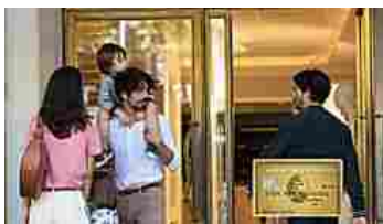
Richiedi Carta Oro: €100 per i tuoi... American Express Gold