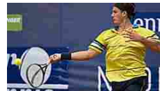
La settimana... Il torneo è valido per l'accesso alle prequalificazioni degli...