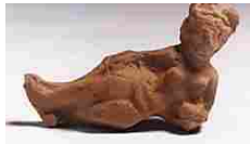
A Torino la conferenza... Appuntamento giovedì 5 dicembre alle ore 18