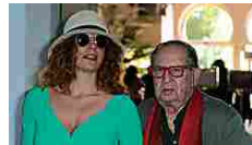
Tinto Brass dimesso... VanityFair.it