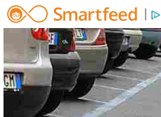
Da domani la sosta in... Strisce blu attive tutti i giorni fino al 22 dicembre. Le navette resteranno invece...