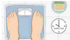
La spirulina velocizza la... leultimenotizieblog.com