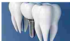
Ecco quanto dovrebbe... Dental Implants | Sponsored Listings