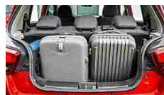
KUV100: c'è spazio... Mahindra Italia