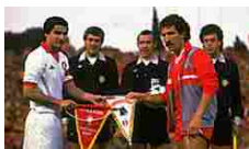
L'omaggio di De... VanityFair.it