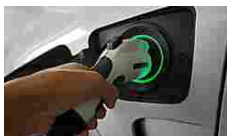
Il costo delle auto... Hybrid Cars | Search Ads