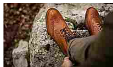
Gli intermediari alzano... Velasca