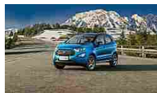
Ford EcoSport a €... Ford Blue Days.