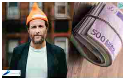
Le Voci Sono State Confermate - Tutta l'Italia è Senza Parole