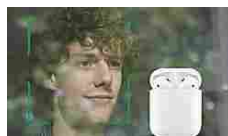
Sorpresa! il Conto... Bnl.it