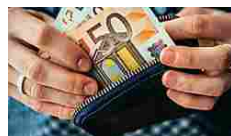
Un investimento di soli... Marketing Vici