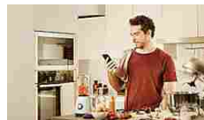
Con Ore Free di Enel... Scopri ora.