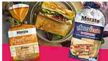
Scopri i premi e come partecipare su... moratoepremiato.it