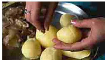
Intestino: dimentica i probiotici e... Nutrivia