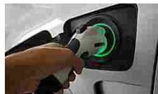
Il costo delle auto... Hybrid Cars | Search Ads