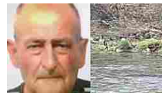
Riconosciuto dai... Questa mattina il fratello ha confermato l'identità della salma.