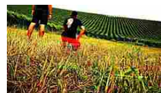
Brutal Trail: conto alla... Conto alla rovescia per il Brutal Trail di Ghemme in programma il 3 novembre...