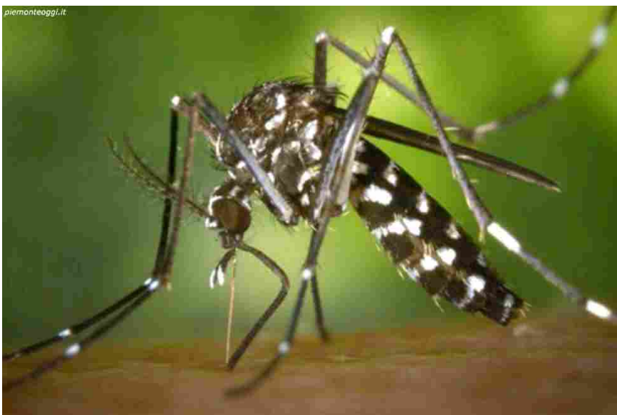
Zanzara Tigra -