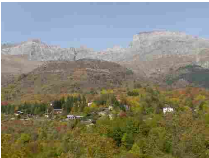
Veduta autunnale di Viozene d'Ormea (CN), punto di partenza della GTA

C'è tempo fino al 31 ottobre per inviare foto, video e storie grafiche con la Grande Traversata delle Alpi quale filo conduttore