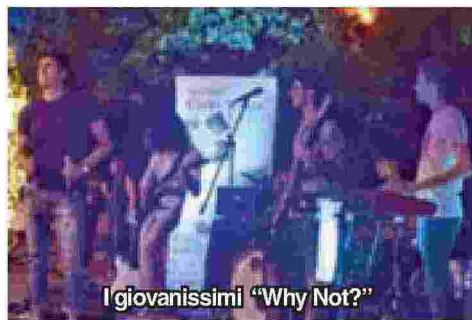
I giovanissimi “Why Not?”