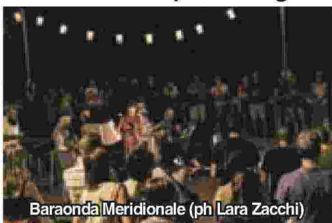
Baraonda Meridionale

CASALE (am) - È stato un successo oltre le aspettative il week end di apertura degli eventi organizzati nell'ambito di “Energica on the river”, l'iniziativa organizzata dalla società di vendita del gas partecipata da Amc e dal Comune di Casale Monferrato per valorizzare e fare riscoprire ai casalesi (ma anche ai turisti) la bellissima passeggiata del Lungo Po che nelle scorse settimane è stata abbellita con una scenografica illuminazione nei colori di Energica, il giallo, l'arancio e il blu. “Siamo soddisfatti, la gente che ha partecipato agli eventi era molto contenta e abbiamo ricevuto tanti commenti positivi, grazie anche alla fattiva collaborazione con il Comune che ci ha consentito di utilizzare gli spazi del Lungo Po e gli addetti di Cosmo che han-