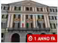
Cronaca Monterosso Grana, aveva dato fuoco alla casa di famiglia: condannato a due anni e sei mesi