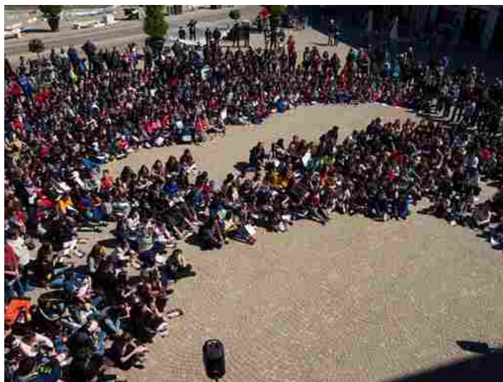
I partecipanti al flash mob di Racconigi