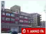
Sanità Al Santa Croce di Cuneo impiantata per la prima volta al mondo una protesi cervicale in materiale biologico