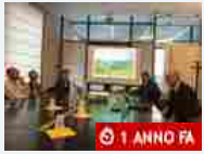
Eventi Presentata ad Alba la settima edizione del Trail del Moscato