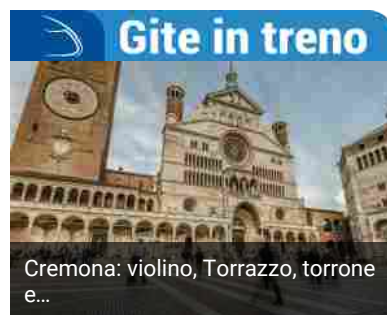
Cremona: violino, Torrazzo, torrione e...