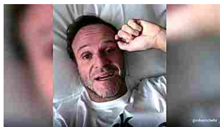
Barrichello dal letto d'ospedale rassicura sui social: "Sto meglio"