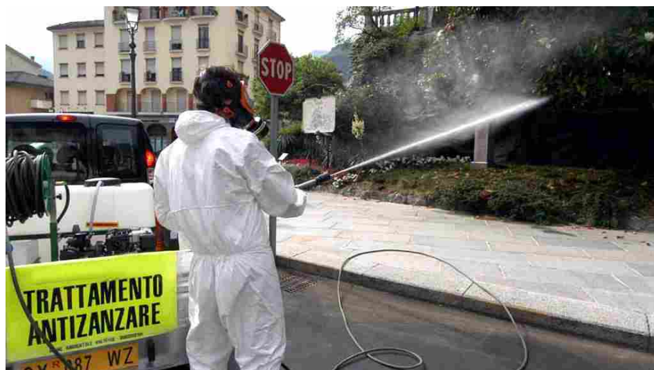
Un trattamento anti zanzare

Richiesta avanzata dall'assessore regionale all'Agricoltura Giorgio Ferrero al ministero della Salute e ora corredata dall'approvazione della massima assise piemontese