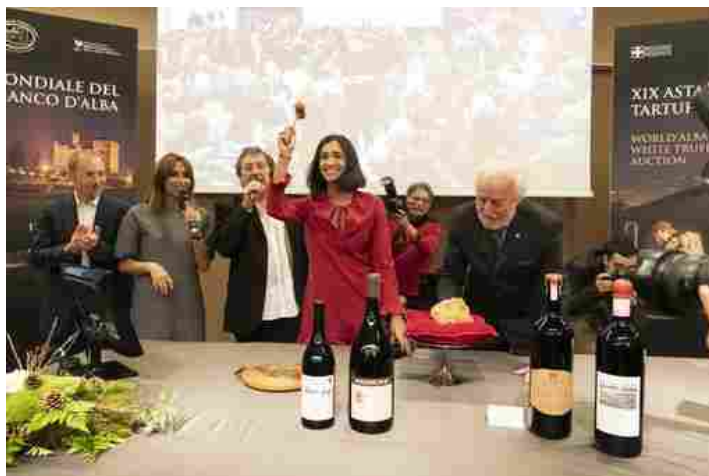
Alcune immagini dell'Asta

I migliori esemplari di Tartufo Bianco d'Alba sono stati mandati all'incanto in occasione della XIX edizione dell'Asta Mondiale del Tartufo Bianco d'Alba, rinnovando il collaudato connubio tra questo magnifico prodotto della terra e la solidarietà internazionale.