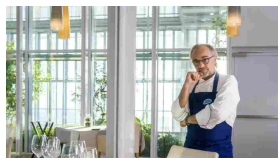
Il Sistema ...