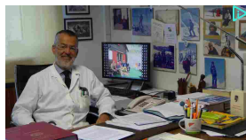
Tornano a Cuneo le ...

A Bene Vagienna appuntamento con l'Araldica (h. 18:38)