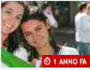
Attualità Servizio civile: boom di candidature per i 25 posti a disposizione