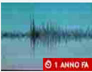
Cronaca Il "terremoto nucleare" registrato anche a Novara