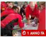
Attualità Due interventi al giorno per soccorrere cercatori di funghi