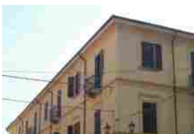
Trino: accattonaggio vietato in città