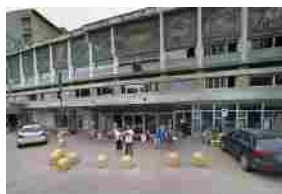
Addio al traumatologo Giorgio Groppo, aveva 65 anni