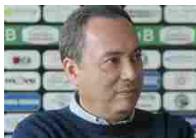
Ufficiale, anche la Fige con Pro, Siena e Ternana contro la sentenza a favore del Novara