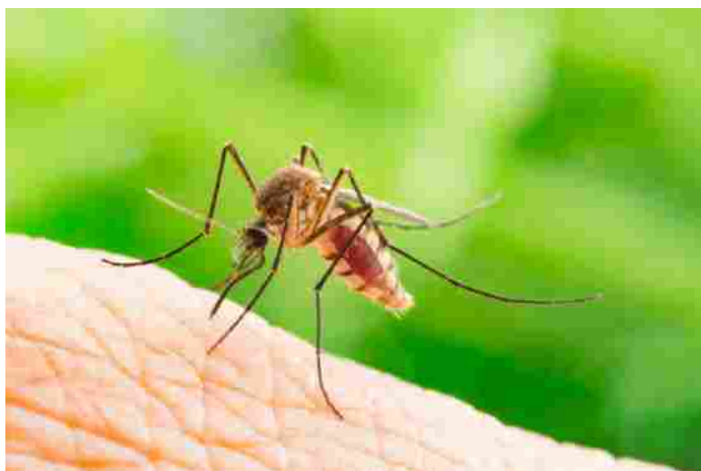
Emergenza zanzare: a Biella una serata per parlarne