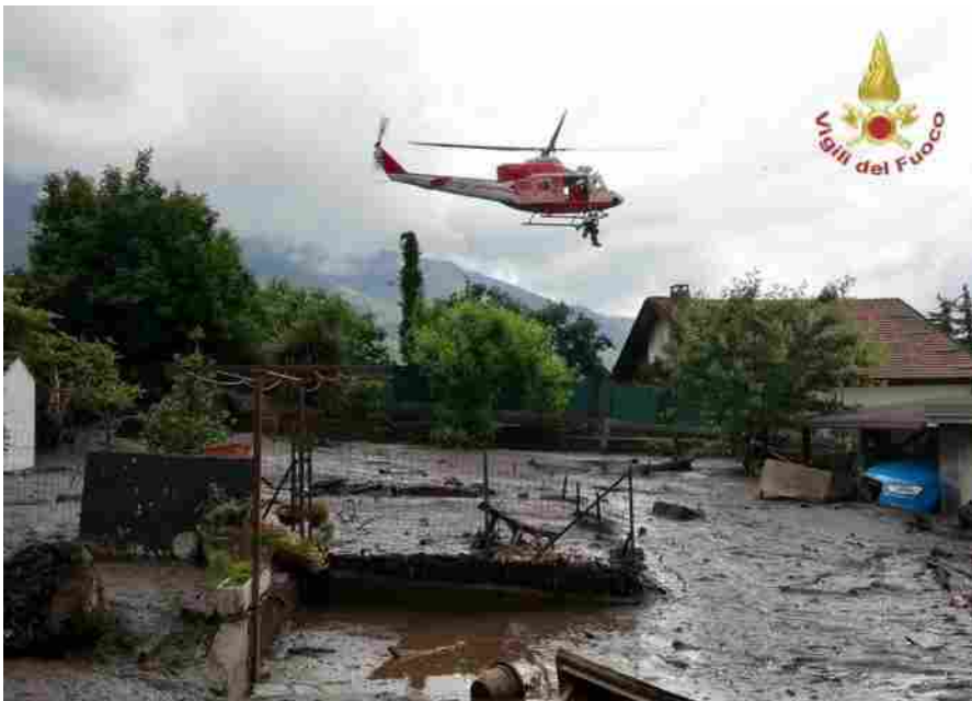
Il Comune di Bussoleno invaso dalla massa di fango e detriti